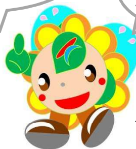
ハローワーク川崎 マスコットキャラクター 「はなさきちゃん」